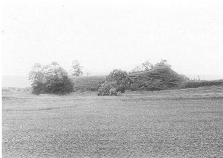
Perkūno kalnas. Šiaulių r., Kužių apyl., Luponių k.

įvykti jų dvikova. Rigvedoje pasakojama, kad Indra užmušė drakoną, kuris buvo ant kalno: áhann áhim párvate śiśriyāṇám“ (RV I 32, 2). Baltarusių tautosakoje taip pat užfiksuotas motyvas, kad griaustinio dievas Piarunas ant kalno įveikia savo priešą velnią: „Дык тут на гэтой горе прыун чорта забив“ (217, p. 7). Vienoje lietuvių sakmių apie Perkūną, kuris medžioja velnią (LPK 3452), apibūdinant veiksmo aplinkybes, teigiama, kad miško sargas, priėjęs kalnelį, pamato iš lapės urvo išlendantį velniuką, kuriam kraipantis pradeda griausti: