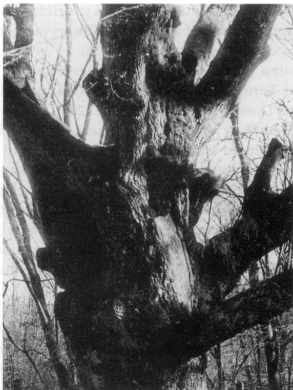
Perkūno ąžuolas Plungės m. dvaro parke.

Ąžuolus kaip lietuvių valstiečių garbinamą objektą S. Rostowskis pamini greta Perkūno, „griausmasvaidžio dievo“, kurį šis istorikas laiko romėnų Jupiterio atitikmeniu. Antrojoje ištraukoje Perkūnas su ąžuolais dar aiškiau siejamas: ąžuolai čia apibūdinami kaip Perkūnui skirti medžiai.