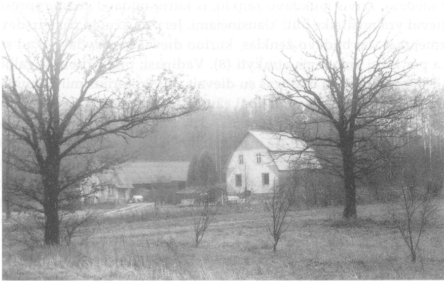
Perkūnų kaimo sodyba prie ažuolų. Klaipėdos r., Vėžaičių apyl.

Gana dažnai Perkūno ratai apibūdinami kaip ugniniai: „Pėrkunas... padangėmis ant debėsiun ugnies ratais, važinėdamas žuri, kan žmonės ant žamės veikia; ant ko supykens, pradeda šmarkštei važuoti ir dundinti, nog to paaina dardėjimas ir grausmas“ (BsFM, p. 177–178). „Perkūnas važiuoja su ugnies ratais“ (LTR 739/20/); žr. taip pat LTR 739/3/; LTR 832/18, 35/; LTR 2132/34/). Ugniniai ratai – tai, be abejo, aliuzija į žaibą. Tačiau ratai gali būti ir akmeniniai ar geležiniai: „Kada Perkūnas važiuoja per dangų su akmeniniais ratais, tai iš po ratų ugnis šoka, o tas bildesys yr griausmas“ (LTR 2567/228/). „Jis [Perkūnas – N. L.] visada sėdi geležiniuose ratuose ir važinėja per geležinius tiltus. Greitai lekia tais geležiniais tiltais ir iš po ratų lekia ugnys“ (LTR 284/713/).