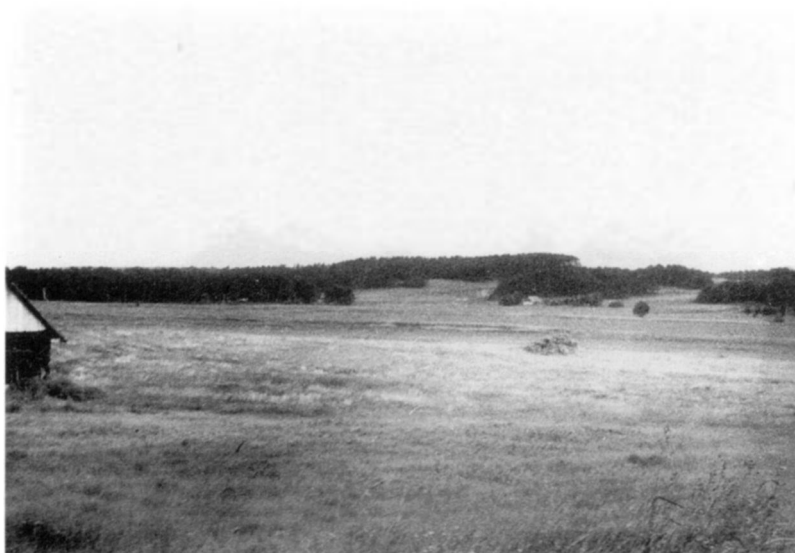
Perkūnkalnis Ventos slėnyje. Kelmės r., Šaukėnų apyl., Jurgoniškių k.

vienas žmogus, įlindęs į kalne esantį urvą, pamatė viduje velniukus (LMD I 171/1). Per kalne esantį urvą velniai, matyt, pasiekdavo žemutinį – požemio – pasaulį. Taigi kalnas turi ryšį su abiem opoziciniais mito personažais – ne tik su Perkūnu, bet ir su velniu 1 .