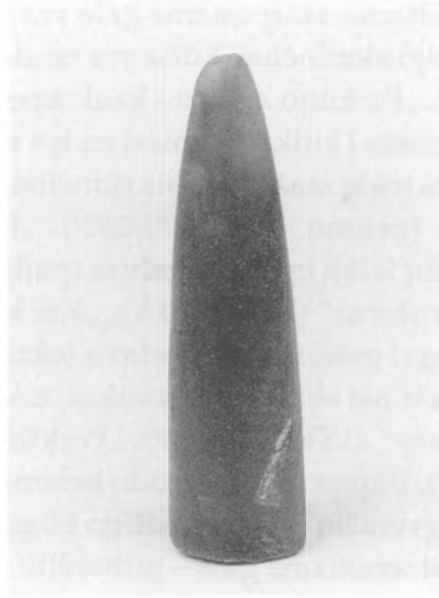
Perkūno kulka, rasta Panevėžio r., Piniavos apyl., prie Lėvens upės. Tose apylinkėse ji dar vadinama kaukaspeniu, laumės pirštu.

ugnelei uždegti“ (LTR 763/16b/). Šventas Petras funkciniu požiūriu čia atitinka Perkūną. Ko gero, žaibas asocijavosi su ugnimi, įžiebiamą trinant du akmenis. Pats griaustinio dievas galėjo būti laikomas tos dangiškos ugnies – žaibo – įkūrėju.