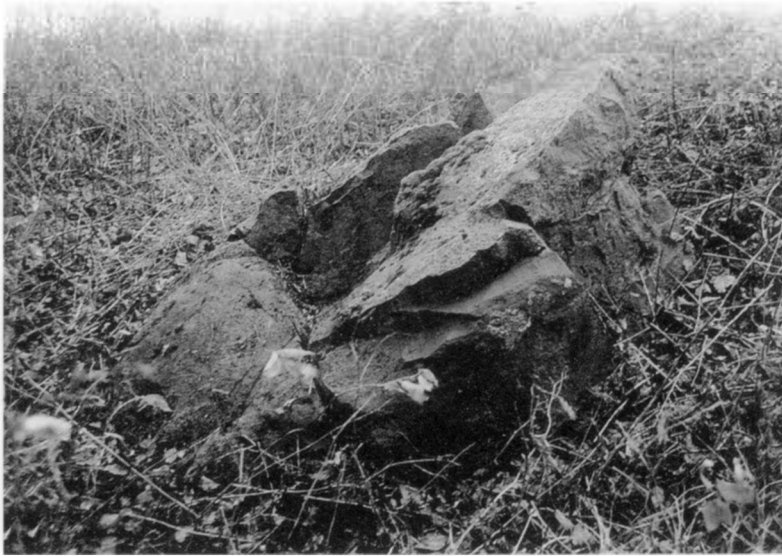
Perkūno akmuo. Varėnos r. ir apyl., Papiškių k.