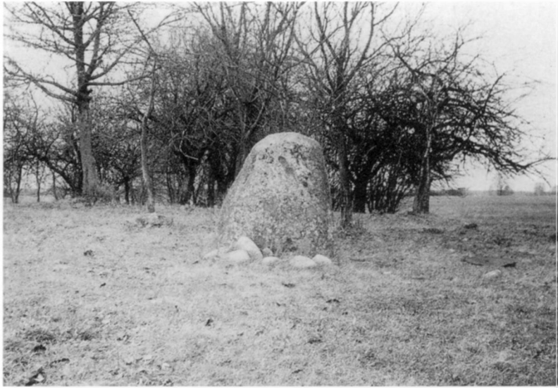
Velnio akmuo (akmuo su „velnio čebatėliu“). Alytaus r., Saldutiškio apyl., Silgionių k. V. Vaitkevičiaus 1993 m. nuotr.

Su akmenimis velnias glaudžiai siejamas ne tik sakmėse, bet ir padavimuose. Viename padavime pasakojama: