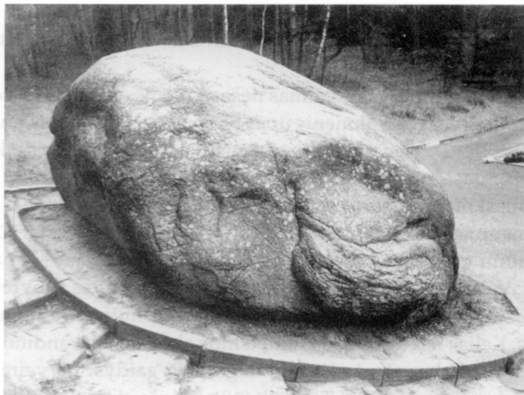
Puntuko akmuo. Anykščių r. ir apyl., Dvaronių k.

Padavimas kalba, kad labai senai palei Lėvens upę velnias nešęs didelį maišą akmenų prikroves. Maiše tarp mažų akmenų buvęs didelis didelis akmuo. Tai tas didysai akmuo nusmuko maišo galan ir pratrėnė maišo galą. Netrukus maišas praplyšo ir tas didysai akmuo šlamokšt ir iškrito Smilgių kaimo ganyklos. Tada pro tą skylę bir bir ir pabiro akmenys. Pribirėjo akmenų pilnas laukas. Tai nuo tada Lėvens upės pakrantėje šitie akmenys atsirado ir dabar tebėra, todėl ir ta vieta vadinama Akmenutė. O Smilgių arklių ganykloje dar ir dabar teberiogso tas didysai velnio pamestas akmuo (LTR 2993/10/).