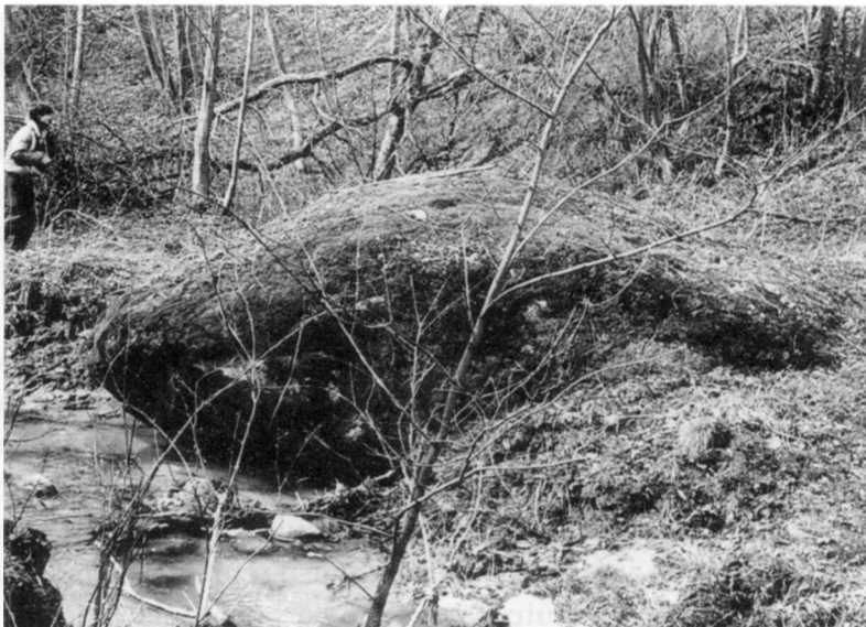
Pasakojama, kad šiuo akmeniu velniai norėjo uztvenkti upelį. Raseinių r., Nemakščių apyl., Paskirtinio k.

Velnius destruktivus ir Perkūno atžvilgiu. Perkūnas pyksta ant velnio dėl jo nepadoraus elgesio per audrą. Velnius erzina griausmavaldį, reiškia jam savo panieką – šaiposi, rodo liežuvį, pasturgalį, vaiposi, juokiasi (LPK 3452). Velnius tyčiojasi ne tik iš Perkūno, bet ir iš žmonių. Pakelėje žmogaus priglaustas sulytas oželis (velnius) mėgdžiojasi. Už tai jis nutrenkiamas perkūnijos (LPK 3300). Velnius apgaulinėja žmonės: siūlo mainytis pypkėmis, šautuvais, arkliais, o paskui iš jo pakeisto daikto telieka rąstas, kelmas, arklio kanopa (LPK 3302). Nelabasis naktį klaidina keliautojus, vedžioja po balas, gąsdina (LPK 3420). Velnius, pasivertęs kaimynu, kviečia pernaktoti pas save. Atsibudęs žmogus mato, kad guli klampioje baloje (LPK 3332). Apie velnią pasakojama, kad jis, tarnaudamas pas ūkininką, išmoko jį daryti degtinę (LPK 3291). Įgijusi kunigo pavidalą, ši būtybė ateina į vestuves ir ragina žmones gerti degtinę (LPK 3330). Bernais pasivertę velniai šokina vakarėliuose merginas, jas prikankina ar nusigabena su savimi (LPK 3251). Velniai netgi lupa žmonėms odą (LPK 3257), gundo juos, vilioja į nelaimę (LPK 3380).