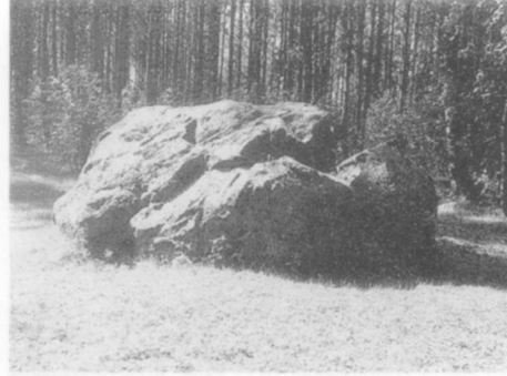
Velnio neštas ir pamestas akmuo. Mažeikių r., Tirkšlių apyl., Geidžių k.