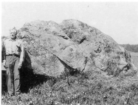
Velnio neštas ir pamestas akmuo. Molėtų r., Dubingių apyl., Kreiviškių k.