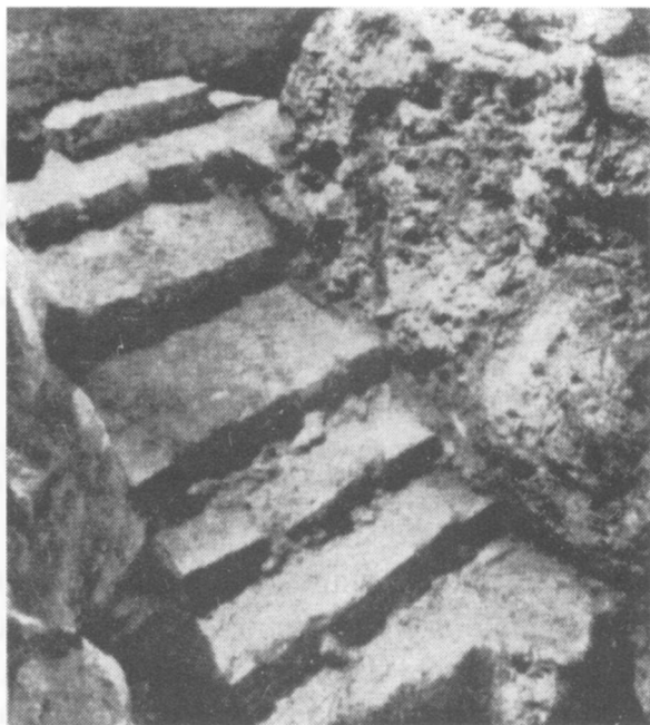
Katedros šiaurinės navos senieji laiptai (70, p. 15)

kama ir Jeruzalės šventovėje. Pažymėtina, kad pati Jeruzalės šventovė, anot M. Eliadės, buvo imago mundi , t.y. simbolizavo pasaulį. Šioje šventovėje būdavo pašventinamas ne tik Kosmosas, bet ir Laikas (274, p. 52). Tam tikruose šventovės elementuose, jų prasmėje ir struktūroje glūdi Laiko simbolizmas. Taip galėjo būti ir Perkūno šventovėje. Kiekvieną mėnesį, tą dieną, kai saulė išengdavo į naują ženklą, būdavo deginama ugnis ant vienos iš dvylikos altoriaus pakopų. Tai, matyt, ir reiškė periodinį Laiko atnaujinimą bei pašventinimą.